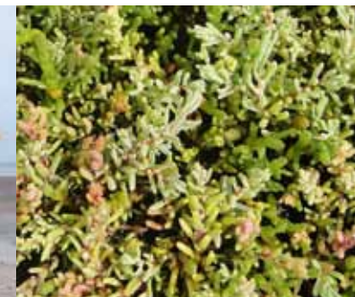
Schorrenkruid en Zeekraal